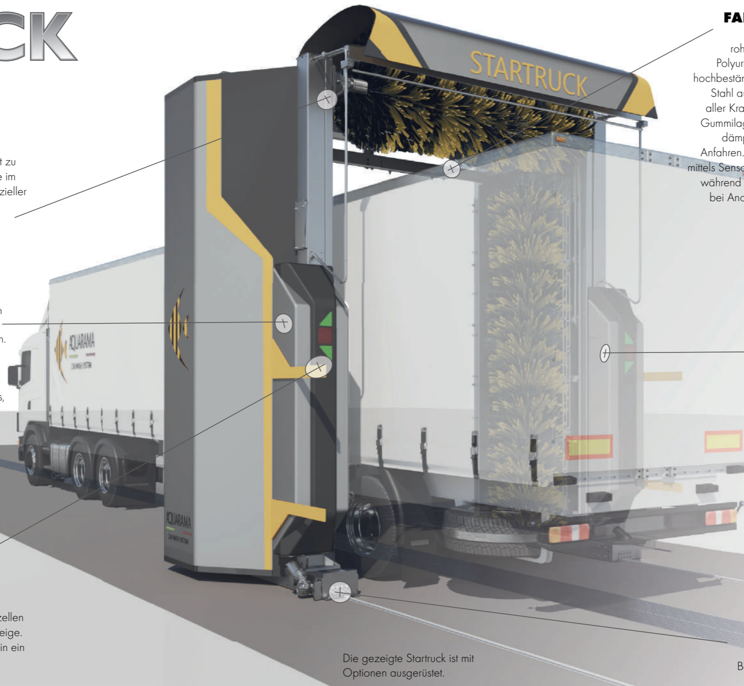
Die gezeigte Startruck ist mit Optionen ausgerüstet.

LED-Ampel mit hoher Lichtintensität; über Fotozellen gesteuerte Vorwärts-, Rückwärts- und Stoppanzeige. Jede der Leuchtplatten wird durch Eintauchen in ein spezielles Isolierharz vollständig versiegelt.