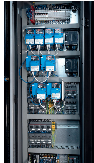
TABLEAU ÉLECTRIQUE NOUVELLE GÉNÉRATION